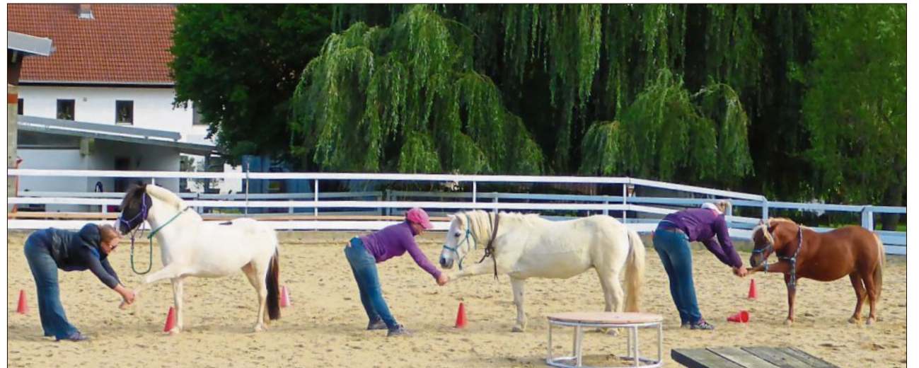
Die drei Stars der Shownummer – die Shetlandponys – und ihre Trainer haben viel Spaß miteinander.

Um die Pferde vor der Pflanze zu schützen, sollten Halter Weiden regelmäßig mähen. Die zunehmende Ausbreitung des Krauts führen Experten auf die Zunahme von Brachflächen, nicht aufwuchsangepasste Extensivierung auf dem Dauergrünland und falsches Grünland-Management zurück.